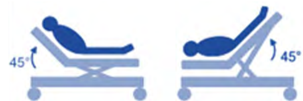
Passive Leg Raise protocol 200-250 ml

HYPERNATRIËMIE OP DE IC – INTERACTIEVE CASUS